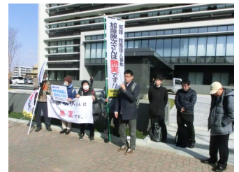
前回の行動の様子

正義のための闘い 積極的参加を！！ 不明な場合は 愛知県本部まで 事前申し込みもお願い 052-684-5825