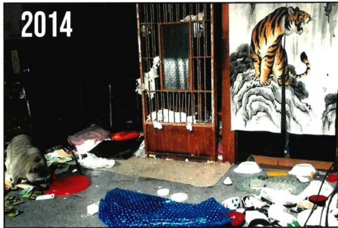
アライグマ(左側)が棲んで、食べ物を探しています。南津島地区の被災家屋内状況