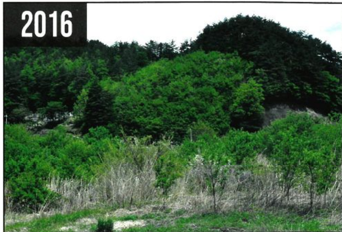
原発事故後に、同じ場所は柳の木が自生し森になってゆく荒廃した田園風景