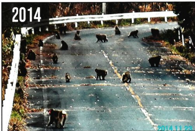
下津島地区につながる道路に猿の大群