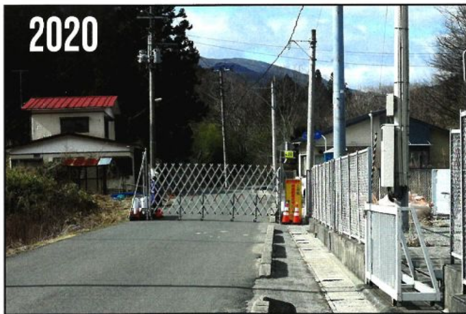
施錠されたバリケードの先に我が家があります。津島地区の一時立ち入りゲート